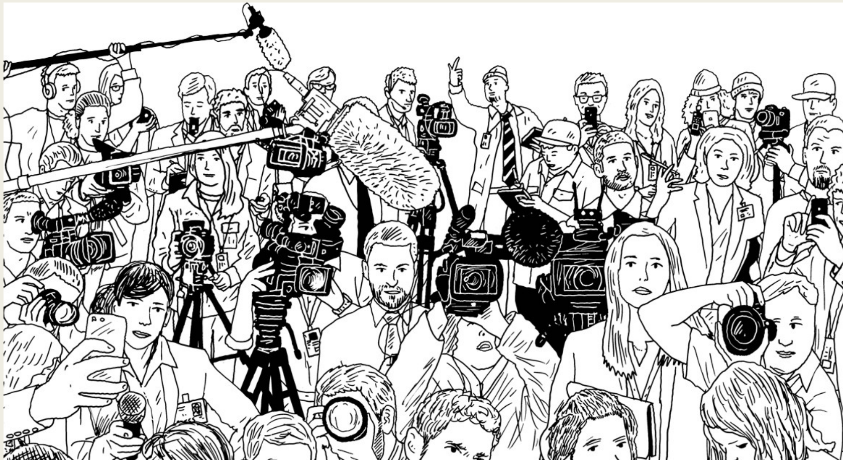
Ilustração Peter Arkle